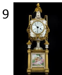
Jean-Antoine Lépine (1720-1814) Pendule, 1770-1785. Porcelaine de Sèvres, bronzes dorés Ville de Paris, musée Cognacq-Jay. J 318