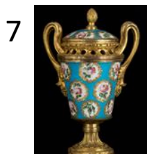
Anonyme Pots-pourris, fin du XVIII e siècle. Porcelaine de Sèvres bleu turquoise, bronzes dorés Ville de Paris, musée Cognacq-Jay. J 291 et J 292