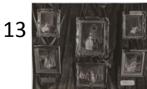
Anonyme Exposition à la Samaritaine de luxe en janvier 1926. Photographie, tirage récent Ville de Paris, musée Cognacq-Jay. J 2000.18