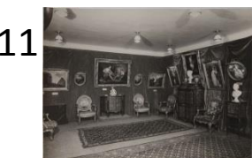
Anonyme Exposition à la Samaritaine de luxe en novembre 1925. Photographie, tirage récent Ville de Paris, musée Cognacq-Jay. J 2000.1