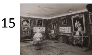
Anonyme Exposition à la Samaritaine de luxe en Printemps 1926. Photographie, tirage récent Ville de Paris, musée Cognacq-Jay. J 2000.29