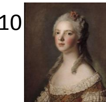
Jean-Marc Nattier (1685-1766) Portrait de Marie-Adélaïde de France, dite Mme Adélaïde, fille de Louis XV, 1750-1751. Huile sur toile Ville de Paris, musée Cognacq-Jay. J 84