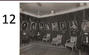
Anonyme Exposition à la Samaritaine de luxe en novembre 1925. Photographie, tirage récent Ville de Paris, musée Cognacq-Jay. J 2000.3