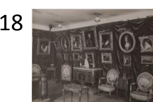
Anonyme Exposition à la Samaritaine de luxe en octobre 1927. Photographie, tirage récent Ville de Paris, musée Cognacq-Jay. J 2000.27