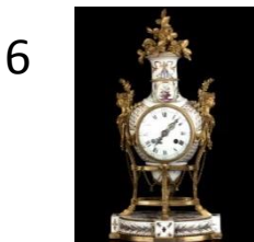
Jean-Antoine Lépine (1720-1814) Pendule, fin du XVIII e siècle. Porcelaine, bronzes dorés Ville de Paris, musée Cognacq-Jay. J 319