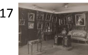
Anonyme Exposition à la Samaritaine de luxe en octobre 1927. Photographie, tirage récent Ville de Paris, musée Cognacq-Jay. J 2000.35