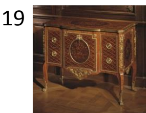
Martin Carlin (1730-1785) Commode, vers 1768-1772 Bâti en chêne et sapin, marqueterie, bronzes dorés Ville de Paris, musée Cognacq-Jay Inv. J 392