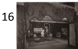
Anonyme Exposition à la Samaritaine de luxe en octobre 1927. Photographie, tirage récent Ville de Paris, musée Cognacq-Jay. J 2000.33