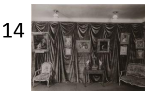
Anonyme Exposition à la Samaritaine de luxe en janvier 1926. Photographie, tirage récent Ville de Paris, musée Cognacq-Jay. J 2000.19