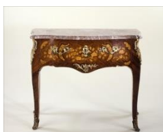
Anonyme Commode en table d'applique , dite encore commode en console ou commode à perruques , vers 1745-1750 Bâti en chêne et sapin, marqueterie de bois divers sur fond de bois de rose et de bois de violette, filets de buis, bronze doré, marbre lilas des Pyrénées Ville de Paris, musée Cognacq-Jay Inv. J 390