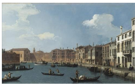
Antonio Canal, dit Canaletto (1697-1768) Vue du canal de Santa Chiara à Venise , vers 1730 Huile sur toile Ville de Paris, musée Cognacq-Jay Inv. J 18

S'inscrivant pleinement dans le développement de la pratique du souvenir de voyage et du Grand Tour, Canaletto est l'un des initiateurs du genre des Vedute , peinture de paysage et de vue urbanistique. Si Venise en reste le lieu privilégié, ce type de représentation témoigne de l'émulation et des échanges entre Europe du Nord et Europe du Sud, s'inscrivant dans la lignée des peintures de paysage flamandes. Cette vue montre la courbe décrite par le canal de Santa Chiara devant le quai de Santa Croce.