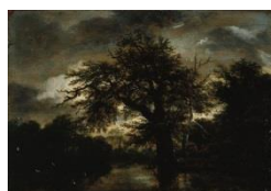
Jacob Isaacks van Ruisdael (1628/1629-1682) Le Vieux chêne , vers 1648-1655 Huile sur bois Ville de Paris, musée Cognacq-Jay Inv. J 103