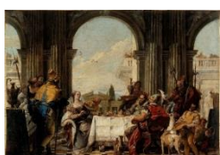
Giambattista Tiepolo (1669-1770) Le Banquet de Cléopâtre , 1742-1743 Huile sur toile Ville de Paris, musée Cognacq-Jay Inv. J 104