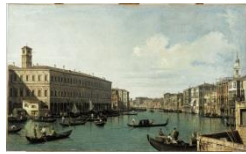
Antonio Canal, dit Canaletto (1697-1768) Le Grand Canal, vu du pont du Rialto , vers 1725 Huile sur toile Ville de Paris, musée Cognacq-Jay Inv. J 17