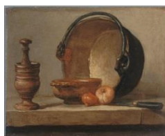
Jean Siméon Chardin (1699-1779) Nature morte au chaudron de cuivre , vers 1735 Huile sur bois Ville de Paris, musée Cognacq-Jay Inv. J 19