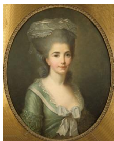
Attribué à Antoine Vestier (1740-1824) Portrait de femme , sans date Huile sur toile Ville de Paris, Musée Cognacq-Jay Inv. J 101