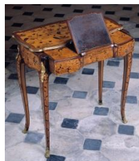
Table mécanique, vers 1760

Bâti en chêne et orme, placage de bois de rose, satiné rubané, amarante, frisage de satiné et bois de rose dans des encadrements d'amarante, bronze doré