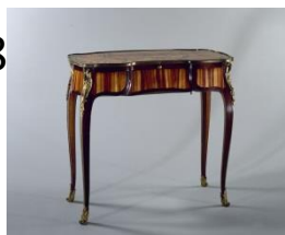
Table mécanique, vers 1760

Bâti en chêne, placage d'amarante, marqueterie de bois polychrome sur fond de houx, bronze doré, cuir