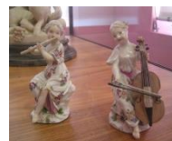
Porcelaine de Meissen Ville de Paris, musée Cognacq-Jay Inv. J 902-905