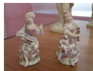
Johann Joachim Kaendler (1706-1775) Quatre jeunes musiciennes , vers 1760