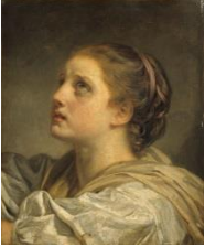
Jean-Baptiste Greuze (1725-1805) Tête de jeune femme , vers 1775-1780 Huile sur toile Ville de Paris, musée Cognacq-Jay Inv. J 47