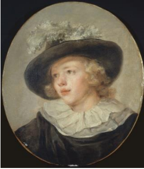
Attribué à Jean-Honoré Fragonard (1732-1806) Portrait de jeune garçon avec un chapeau à plumes , vers 1785-1788 Huile sur toile Ville de Paris, musée Cognacq-Jay Inv. J 31

Le jeune garçon blond est vêtu « à l'espagnole », d'une casaque de velours noir à collerette, et porte un chapeau à larges bords en feutre noir, empanaché de plumes blanches. Fragonard a peint plusieurs portraits d'enfants dans le même esprit, portant des cheveux blonds bouclés ou un grand chapeau de mousquetaire.