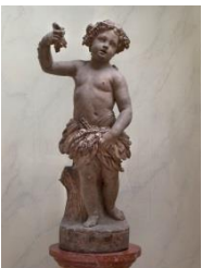
Anonyme français L'Enfant moissonneur , s.d. Terre cuite Ville de Paris, musée Cognacq-Jay Inv. J 251