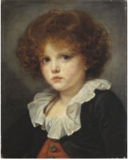
Jean-Baptiste Greuze (1725-1805) Petit garçon au gilet rouge , vers 1775-1780 Huile sur toile Ville de Paris, musée Cognacq-Jay Inv. J 43