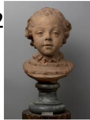
Augustin Pajou (1730-1809) Jeune garçon à la veste aux Brandebourgs , s.d. Plâtre Ville de Paris, musée Cognacq-Jay Inv. J 251